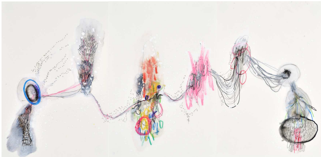
Episode 2. technique mixte sur papier : 20x40 cm ( triptyque), 2010

La galerie Les Nouvelles coïncidences, Paris S'installe à la galerie Passé Simple Rue du Chemin neuf, Sauzon Belle-île-en mer Du 23 juillet au 5 août 2011.