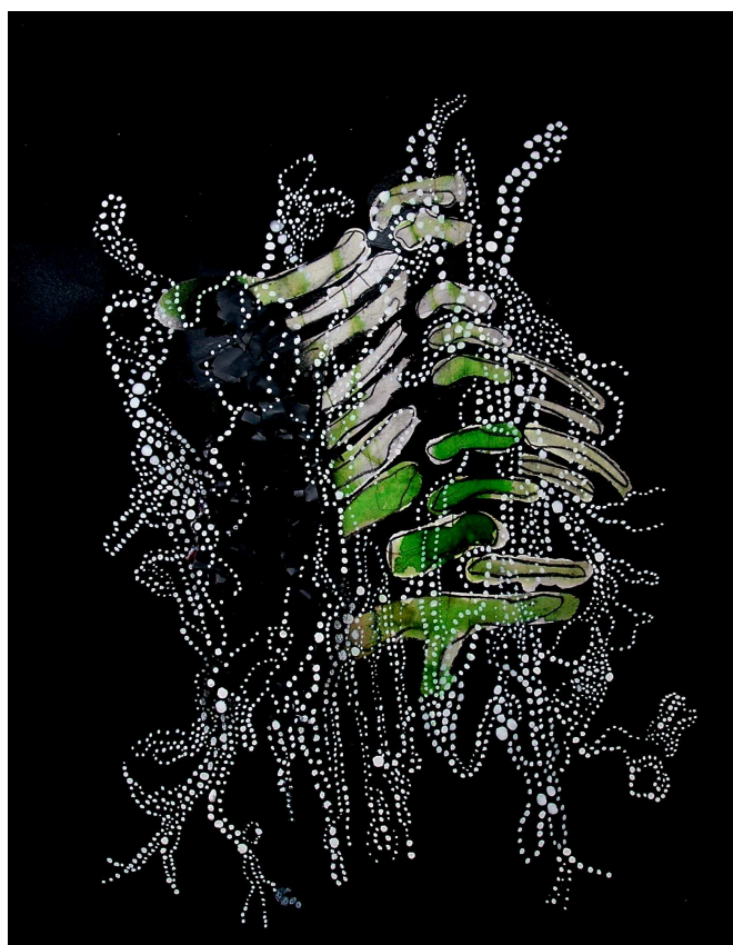
Open Space, 21x29,7 cm, technique mixte sur papier, 2010

Exposition « Open Space » du 23 juillet au 5 août 2011